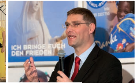
MAI 2014: ERSTES KONZERT IM SCHLOSS SCHÖNBRUNN MIT ILDIKO RAIMONDI UND JUNGEN KÜNSTLERN