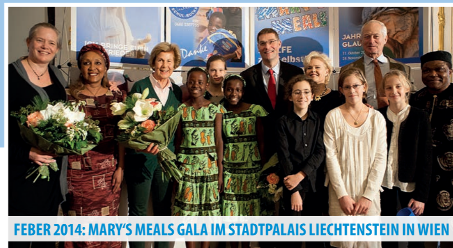
FEBRUAR 2014: MARY'S MEALS GALA IM STADTPALAIS LICHTENSTEIN IN WIEN