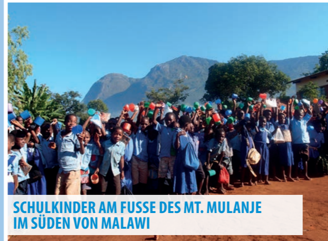
SCHULKINDER AM FUSSE DES MT. MULANJE IM SÜDEN VON MALAWI