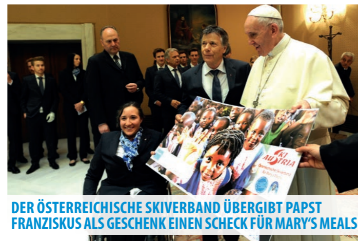
DER ÖSTERREICHISCHE SKIVERBAND ÜBERGIBT PAPST FRANZISKUS ALS GESCHENK EINEN SCHECK FÜR MARY'S MEALS