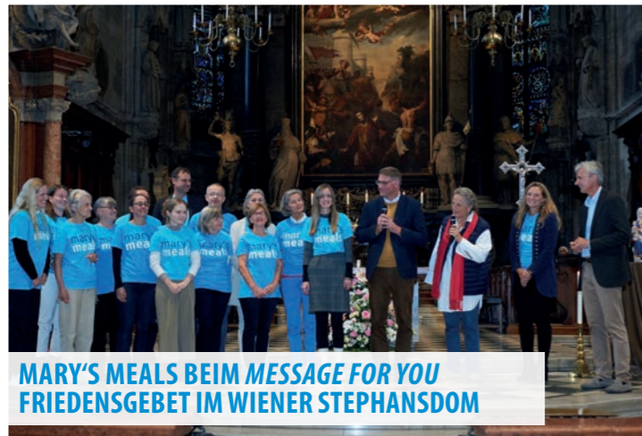
MARY'S MEALS BEIM MESSAGE FOR YOU FRIEDENSGBET IM WIENER STEPHANSDOM