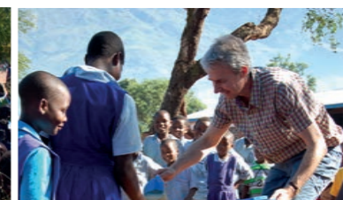
MAI 2013: BESUCH VON SCHULKÜCHEN IN MALAWI, DIE VON ÖSTERREICH AUS GESPONSERT WERDEN