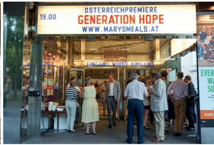
19.00 ÖSTERREICHPREMIERE GENERATION HOPE WWW.MARYSMEALS.AT