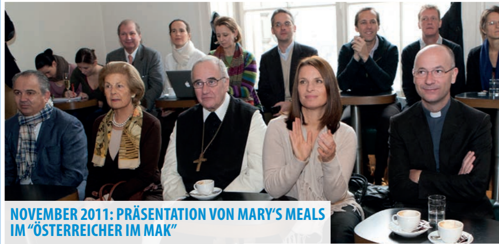
NOVEMBER 2011: PRÄSENTATION VON MARY'S MEALS IM "ÖSTERREICHER IM MAK"