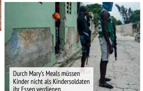
Durch Mary's Meals müssen Kinder nicht als Kindersoldaten ihr Essen verdienen.

100 Kilometer lange Fahrt von einem lokalen Lieferanten zu einem Partnerlager vor einigen Jahren weniger als fünf Stunden. Heute benötigt man dafür einige Tage, da die Lkw Umwege nehmen müssen, um von Banden kontrollierte Gebiete zu umfahren. Manchmal muss der Transport auch auf Booten fortgesetzt werden, um ans Ziel zu gelangen. Trotz all dieser Herausforderungen bleibt Mary's Meals seinem Versprechen einer täglichen Schulmahlzeit für Kinder in